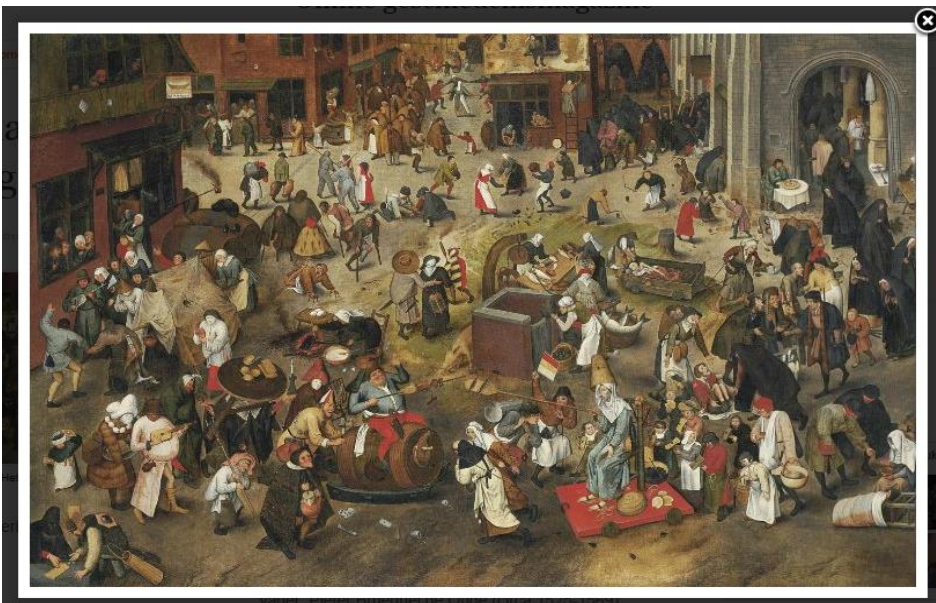
Het gevecht tussen Carnaval en Vasten van Pieter Brueghel de Jonge (1564-1638)